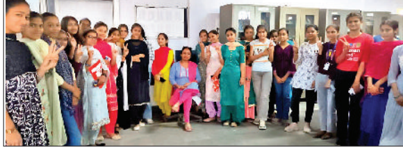
अंबाला। शॉर्ट टर्म कोर्स करने वाले छात्र शिक्षकों के साथ।

लाभार्थी संस्थाओं के छात्रों, शोधकर्ताओं व शिक्षकों को ई-संसाधनों तक पहुंच प्रदान करता है। इंप्लीमेंटेंट केंद्र में तैनात सर्वर के माध्यम से अधिकृत उपयोगकर्ताओं के रूप में विधिवत प्रमाणित होने के बाद सीधे प्रकाशक वेबसाइट से