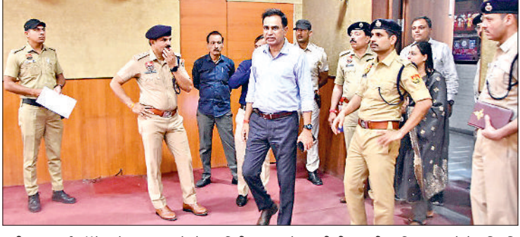
पानीपत। आर्य कॉलेज में मतगणना केंद्रों का निरीक्षण करते हुए डीसी, एसपी आदि।